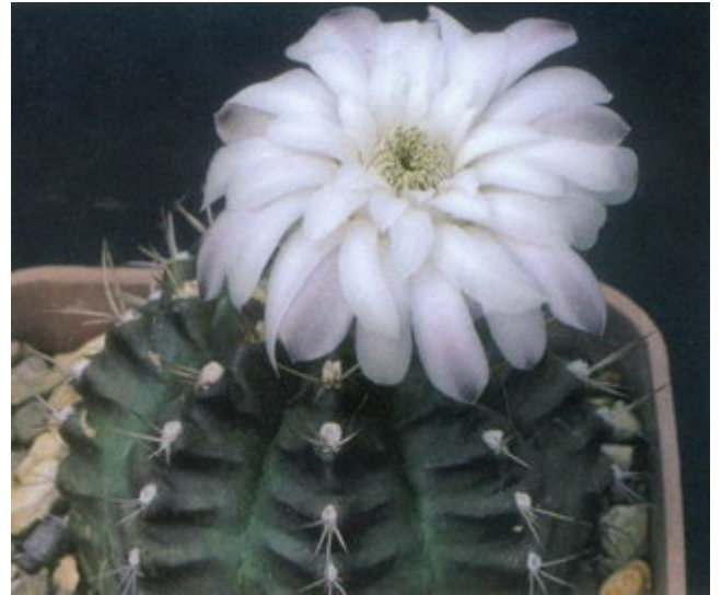
Figure 13 : Gymnocalycium anisitsii , ou si vous préférez, G. damsii

Plusieurs noms ont été rattachés à un niveau infra-spécifique à G. andreae :